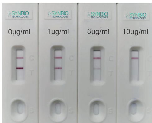
检验卡显色样式图